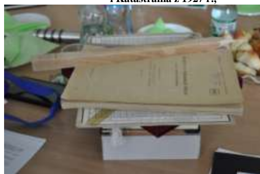
Do kolekcji ...