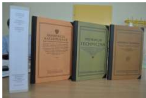
Instrukcje: Techniczna z 1926 r. i 1931 r. i Katastralna z 1927 r.,