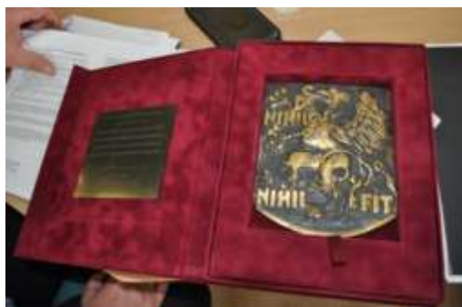
Medal Gryf Pomorski