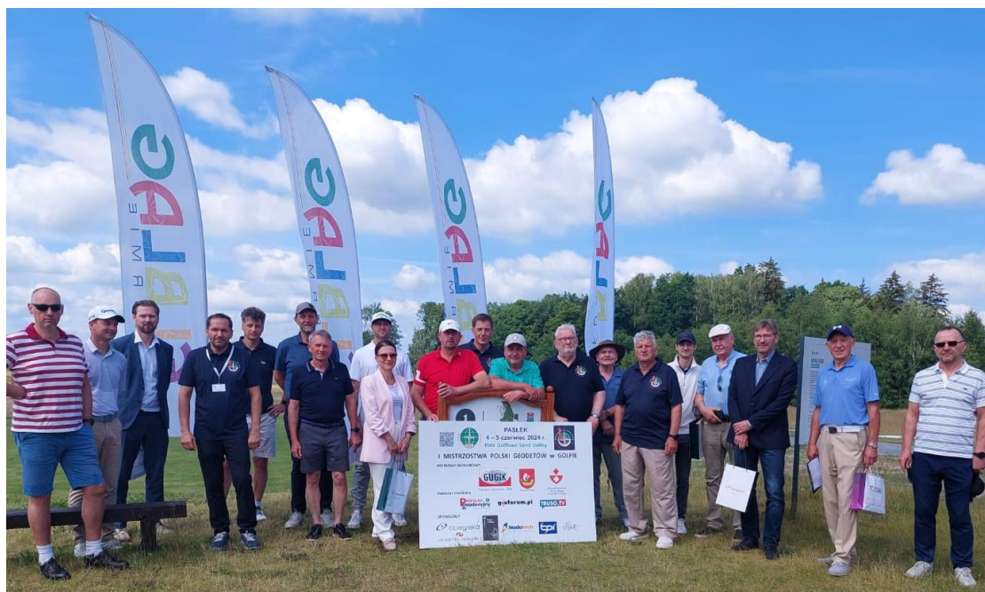
Uczestnicy I MPGwGOLFie