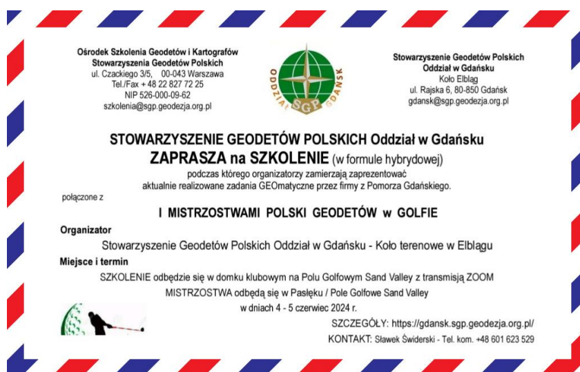
Baner nr 1 – Przegląd Geodezyjny