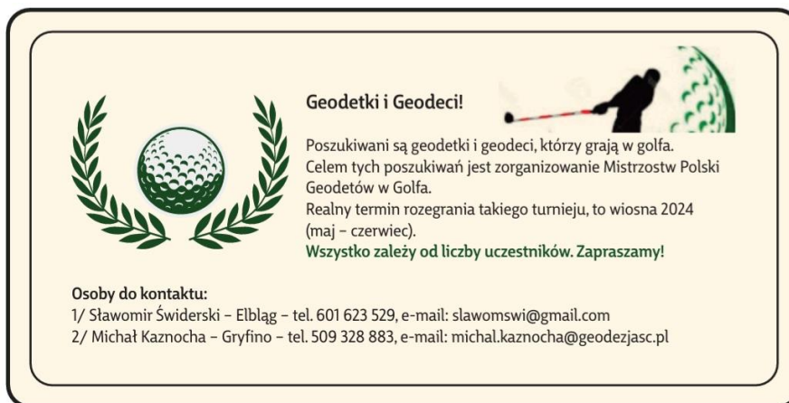
Pierwsza ilustracja graficzna